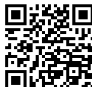
Castillon en fête