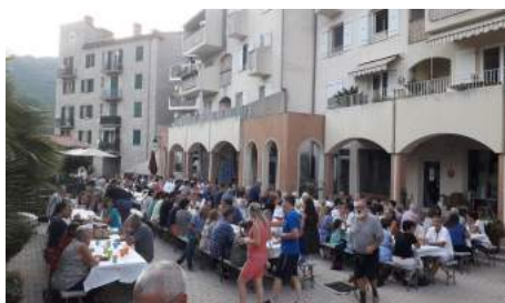
Suivi de la soirée moules frites le 16 juillet organisée par Castillon en Fête