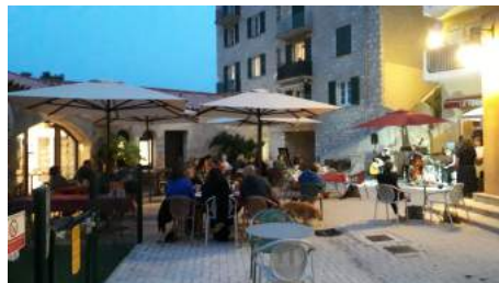
Soirée concert organisé par l'Harmonie le 21 mai