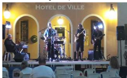
Soirée concert pour les Festivals le 15 juillet