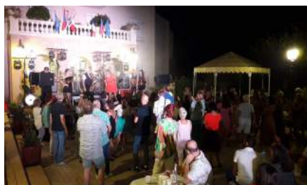
Fête de la saint Julien le 30 juillet organisée par Castillon en fête