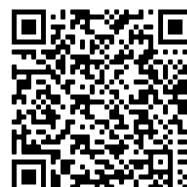
Le Prieure Castillon